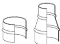
メタルコネクター:270-271