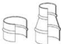
メタルコネクター：270-271