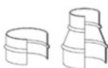
メタルコネクター：270-271