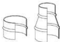
メタルコネクター:270-271