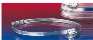
スパイラルホースクランプ: 212