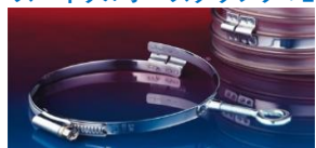
アイレット付クランプ: 217