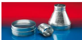
メタルコネクター:270-271