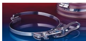
クイッククランプ: 213