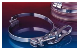
クイッククランプ: 213