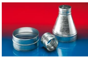
メタルコネクター: 270-271