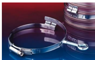
アイレット付クランプ: 217