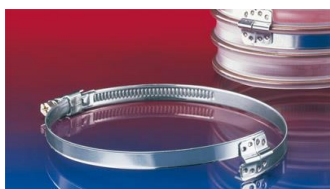
スパイラルホースクランプ: 212