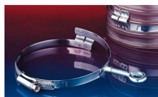
アイレット付クランプ: 217