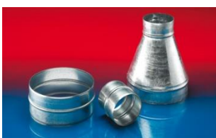
メタルコネクター: 270-271