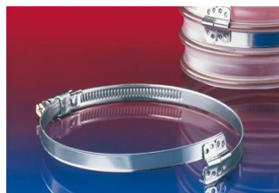
スパイラルホースクランプ: 212