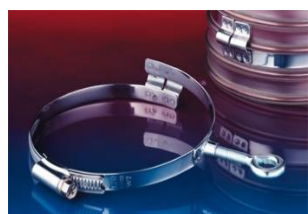
アイレット付クランプ: 217