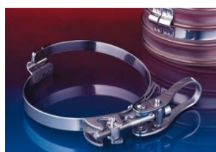
クイッククランプ: 213