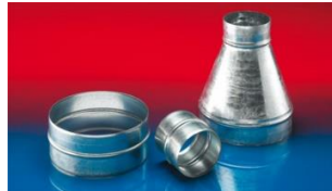
メタルコネクター:270-271